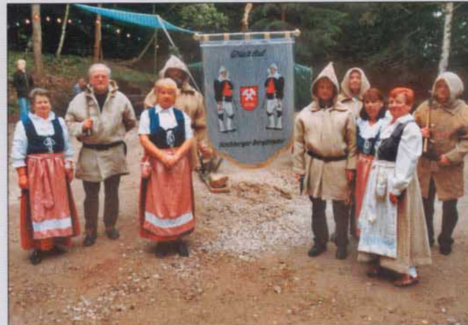
Die »Kirchberger Bergbrüder« - Mitglied im Sächsischen Landesverband der Bergmanns-, Hütten- und Knappenvereine e.V.

Mit einem herzlichem Glückauf Kirchberger Natur- und Heimatfreunde, Fachbereich Bergbau